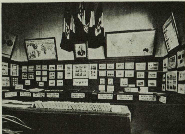
UN LATO DELLA SALA DEL MINISTERO DEGLI AFFARI ESTERI.

Opportuna è parsa, al Comitato ordinatore del X Congresso geografico, la scelta del momento, in cui ha ravvisato il contributo dato dalla Mostra ai lavori del Congresso conforme alla interpre-