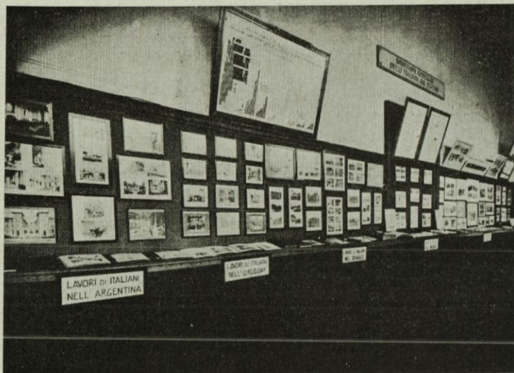
UN LATO DELL'ESPOSIZIONE DELLA DIREZIONE GENERALE DEGLI ITALIANI ALL'ESTERO.

Con tale documentazione si è voluto, altresì, additare agli Italiani, dalla patriottica ed operosa Milano, le vie e le forme nelle quali si riassume la nostra espansione. E gli esposti materiali sono bensì semplici saggi dimostrativi, così dell'attività delle Colonie etniche più fiorenti e delle Colonie di diretto dominio, come della attività esplicata nel Regno, a fini di espansione, da Enti pubblici